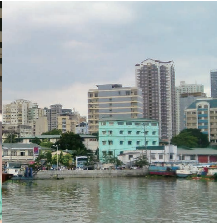
スラムで生きる子どもたちと、発展する都市が対照的な現在のフィリピン

気候変動による地震や大洪水に見舞われ続けた 2015 年も、残すところあとわずかになりました。大震災の傷跡も癒えない内に、またもや洪水に見舞われた東北地方の方々には、どうお見舞いの言葉をお掛けしたらよいのか。又、ヨーロッパの危機と呼ぶべきアフリカやシリア方面からの難民の群れ。私たち日本人には想像をはるかに超える悲惨な事態が B B C のテレビ画面を連日埋め尽くしています。2015 年、残された日々を出来る限り平安に、と祈るばかりです。